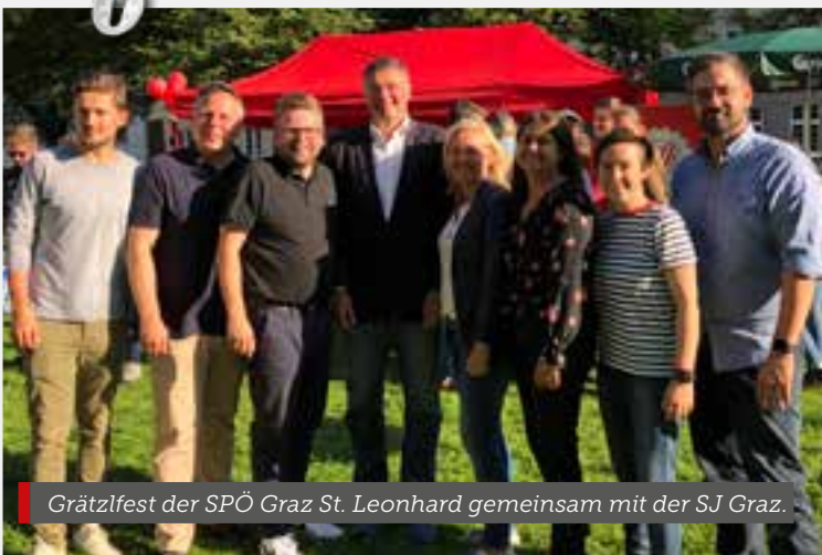
Grätzfest der SPÖ Graz St. Leonhard gemeinsam mit der SJ Graz.