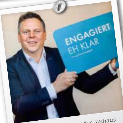
Am 26. Oktober stand das Rathaus ganz im Zeichen des Ehrenamtes!