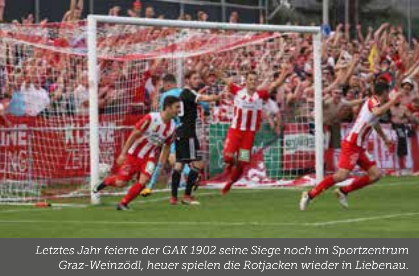
Letztes Jahr feierte der GAK 1902 seine Siege noch im Sportzentrum Graz-Weinzödl, heuer spielen die Rotjacken wieder in Liebenau.

Viele Grazerinnen und Grazer haben kein Verständnis, weil beide Vereine sich ja schon zwischen 1997 und 2007 das Stadion geteilt haben. Was ist heute anders?