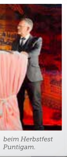
beim Herbstfest Puntigam.