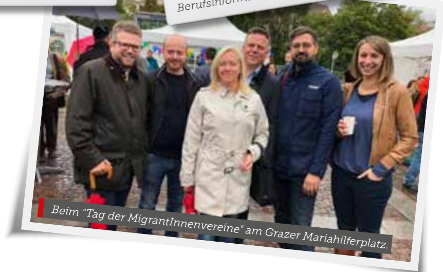
Beim "Tag der MigrantInnenvereine" am Grazer Mariahilferplatz.