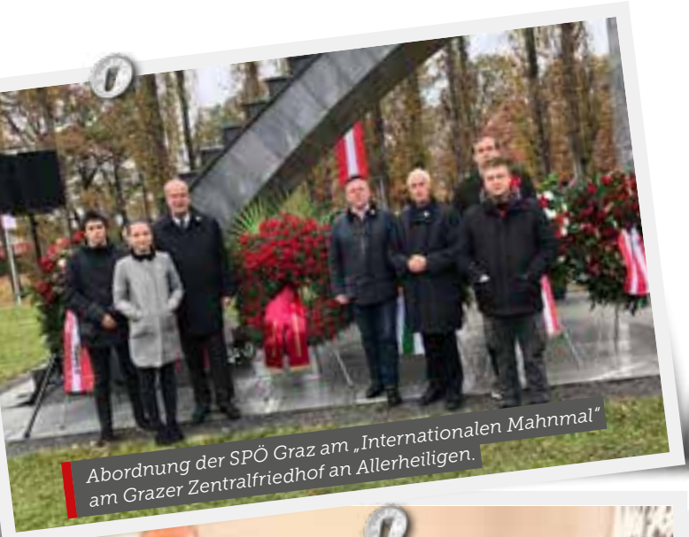
Abordnung der SPÖ Graz am „Internationalen Mahnmahl“ am Grazer Zentralfriedhof an Allerheiligen.