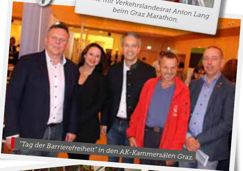
"Tag der Barrierefreiheit" in den AK-Kammersälen Graz.